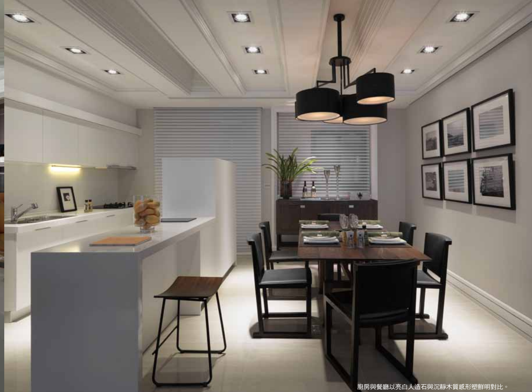
廚房與餐廳以亮白人造石與沉靜木質感形塑鮮明對比。