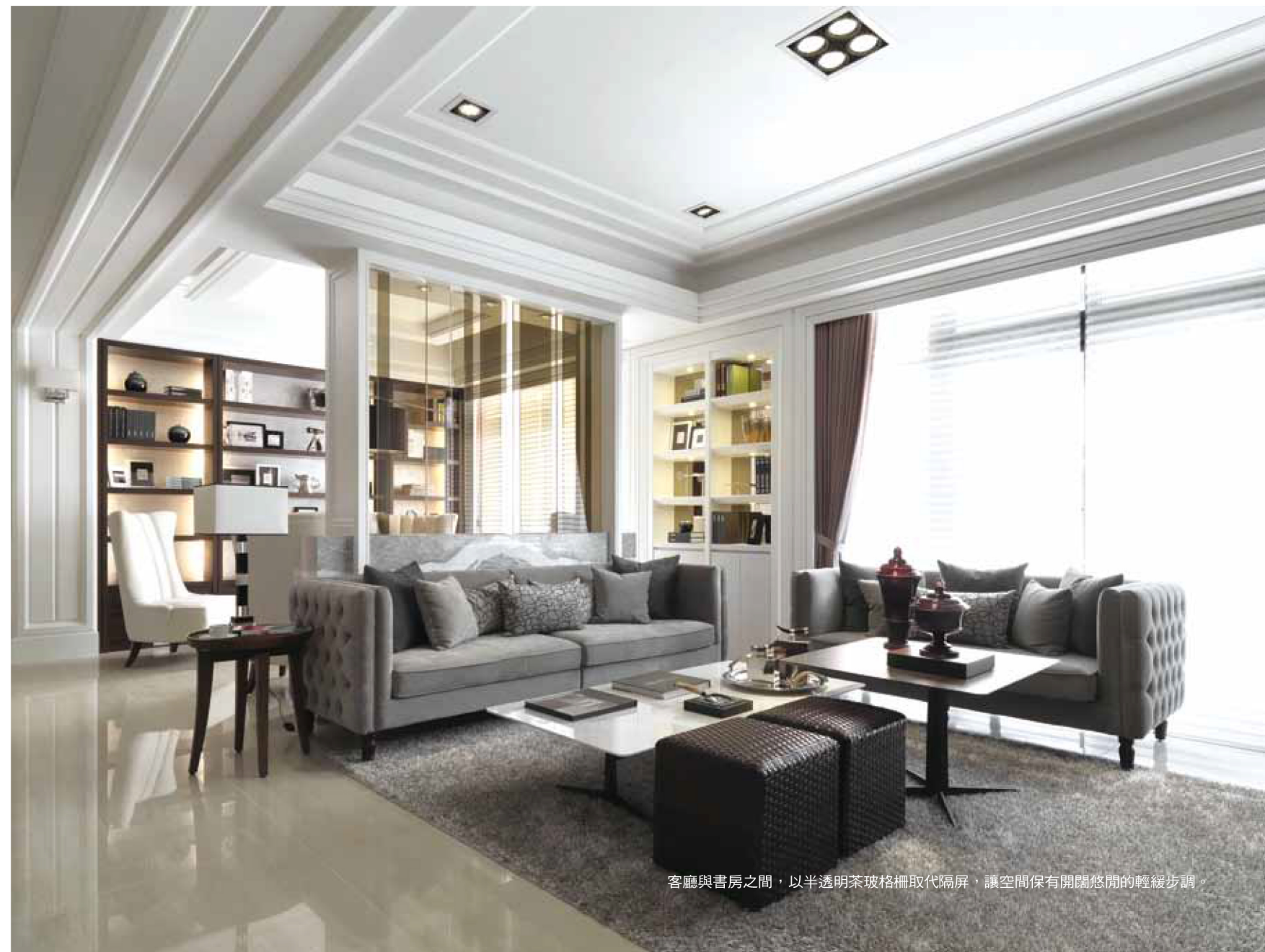
客廳與書房之間，以半透明茶玻格柵取代隔屏，讓空間保有開闊悠閒的輕緩步調。