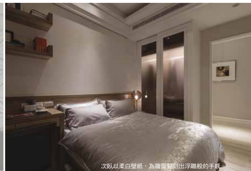
次臥以柔白壁紙，為牆面銘刻出浮雕般的手感。