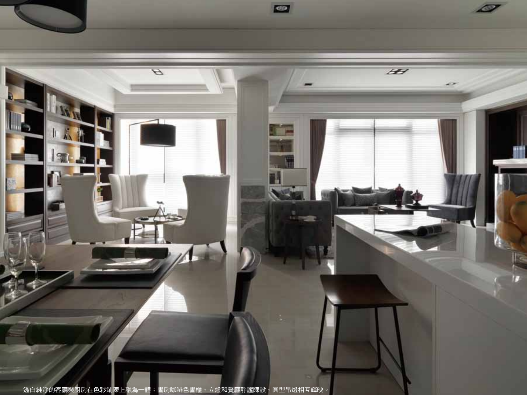
透白純淨的客廳與廚房在色彩鋪陳上融為一體；書房咖啡色書櫃、立燈和餐廳靜謐陳設、圓型吊燈相互輝映。