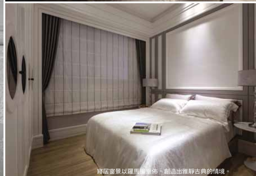
寢居窗景以羅馬簾垂佈，創造出雅靜古典的情境。