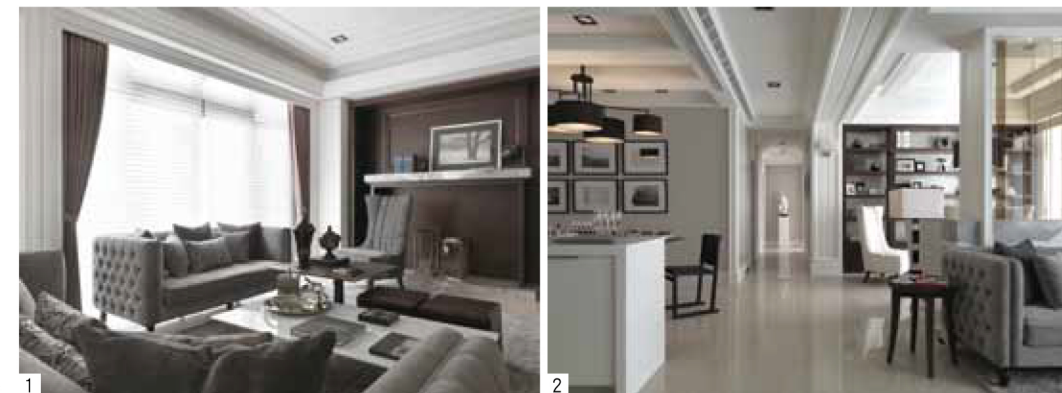
1. 客廳主牆以木皮染色與大理石檯面打造而成。 2. 色調以黑白灰為基底，塑造典雅非凡的空間意象。

另外次臥的寢居風情，設計師於主牆營塑上極具用心。小孩房以柔白壁紙，為牆面銘刻出浮雕般的手感，以不過度飾琢的方式，輕盈地圍塑出壁面獨特的線條質地，同時保有臥房獨具的和緩氛圍；長輩房主牆則以灰色線板拼貼展現俐落工法，大面積寬幅窗景則以羅馬簾垂佈，不僅為臥房創造出柔靜古典的情境，也為空間釀造出細致而詩意的調性主題。