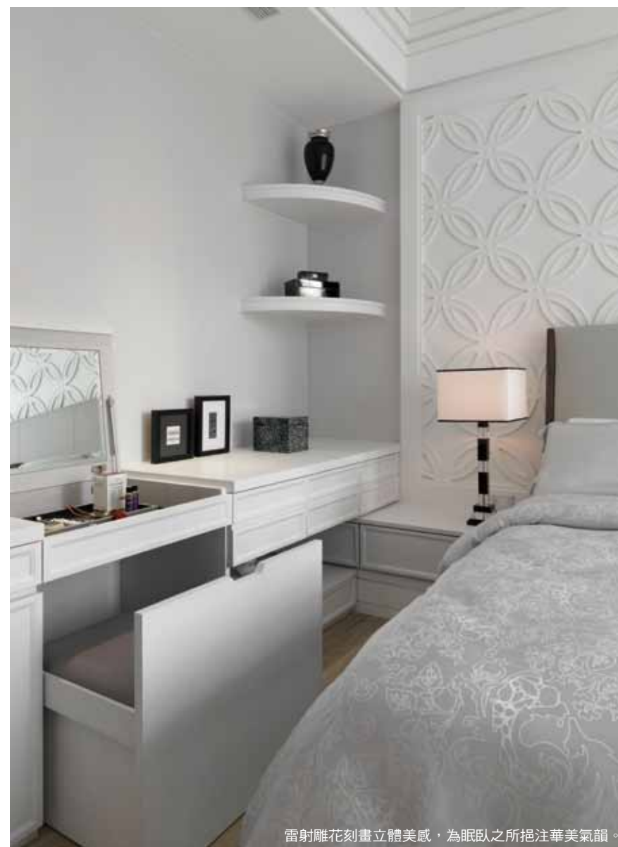
雷射雕花刻畫立體美感，為眠臥之所挹注華美氣韻。